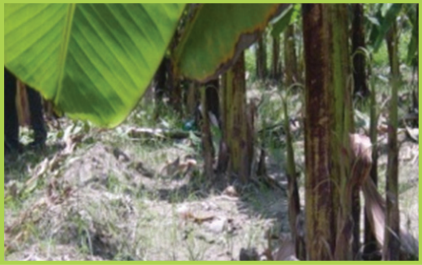
Tè lapli pote ki ap fè bannann