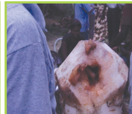
Plan ak yon twou mawoka