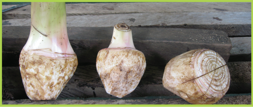
Dezaktivasyon meristèm nan

Aprè blokaj la, mete tout kreyòl yo nan jèmwa yon a kote lot men san yo pa kole. Aprè yon jou ou ka wouze jèmwa a, wap kontinye wouze yo yon fason pou jèmwa pa janm ni gen twòp dlo ni two sèk.