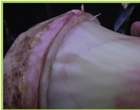
Plan ki sen