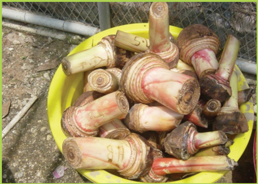
Plan ki netwaye pou ale nan Jèmwa