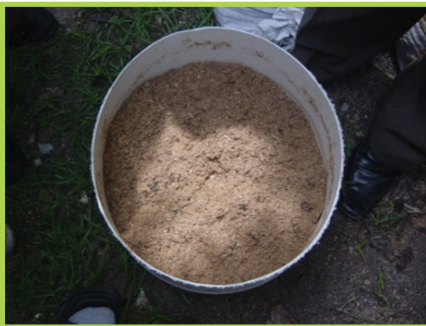
Mete mwatye Poud bwa nan kivèt la