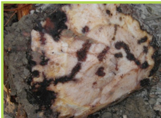
Dega charanson nwa