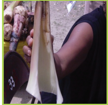
Gèn ki sòti