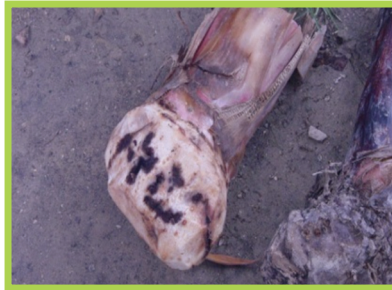
Plan atake pa bon