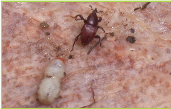
Charanson nwa lè li piti ak lè li gran