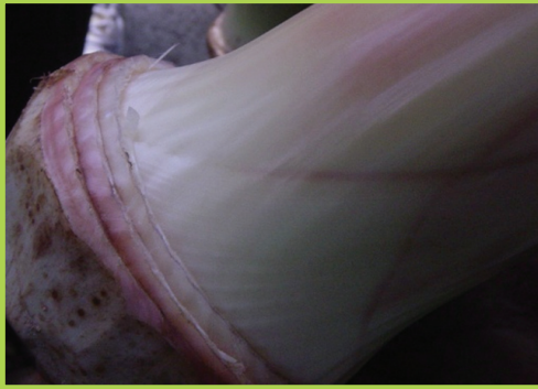
Gèn pou retire