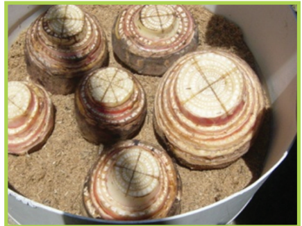
kreyòl ki desaktive nan jèmwa